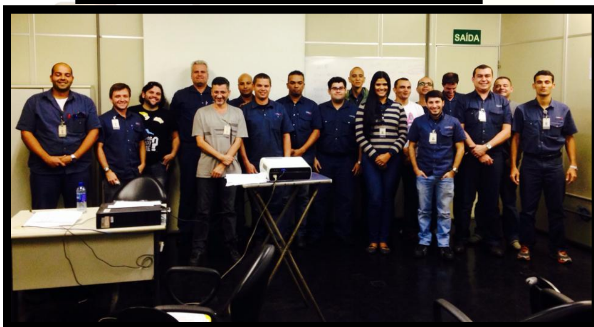
CURSO DE ANÁLISE DE VIBRAÇÕES – USIMINAS – CUBATÃO – SP

Esse módulo atende as exigências e objetivos em diagnóstico de máquinas rotativas através da análise de vibrações, voltadas para a indústria 4.0.