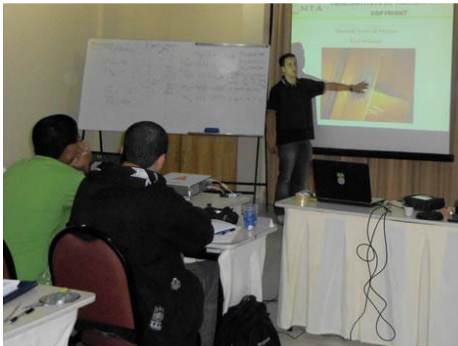
Aula do curso Análise de Vibração V em Belo Horizonte – Balanceamento de Rotores