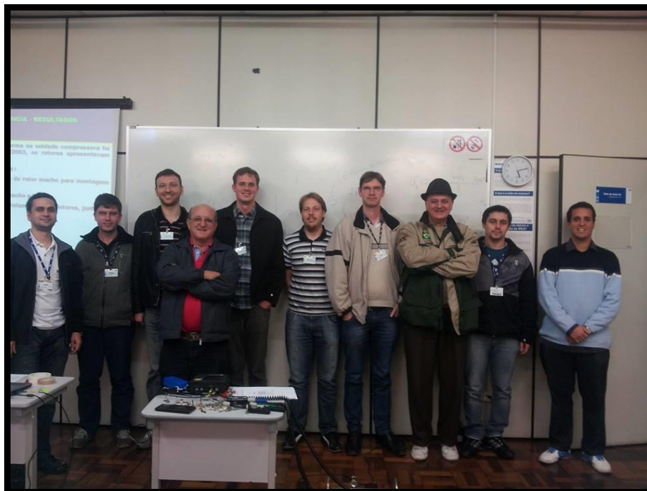
CURSO DE ANÁLISE DE VIBRAÇÕES – WEG – JARAGUÁ DO SUL - SC