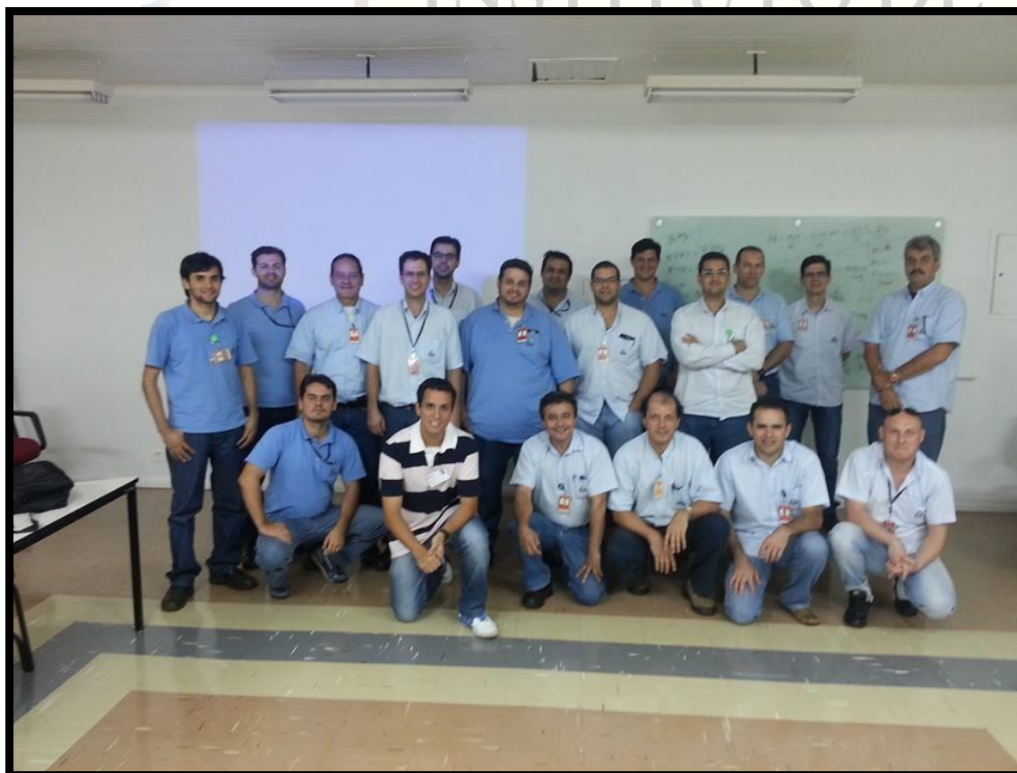
CURSO DE ANÁLISE DE VIBRAÇÕES – ITAIPU – FOZ DO IGUAÇU - PR